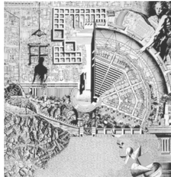
Aldo Rossi: Città Analoga, 1976